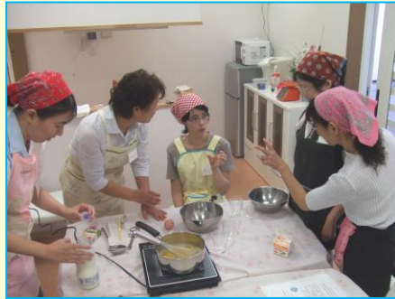
サポートハウス光ヶ丘の料理教室

高齢者のサロン、介護予防講座 ケアラズサロン サークルのミーティング コミュニティ講座「まちの先生」 フリーマーケット 季節のイベント