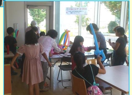
喫茶室ココのパルーンアート作り

レンタルスペース（時間帯による場所貸し） 屋台・イベントグッズ（綿菓子機など）レンタル レンタルボックス（手作り品の展示販売）