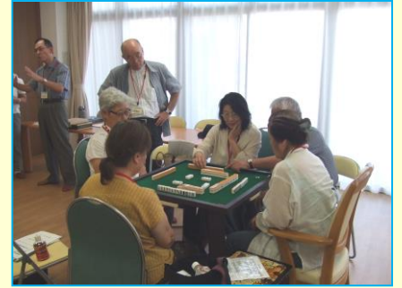
サポートハウス光ヶ丘の麻雀教室