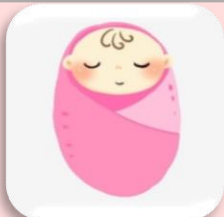
助産師とおしゃべり