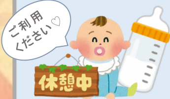
おやすみ処'風のロッジ'