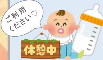
おやすみ処'風のロッジ'