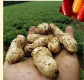
▲八街名産！ ショウガ♥ つやつや人参♥ 落花生♥